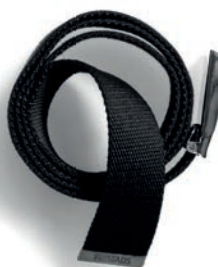
GÜRTEL 9955 CW