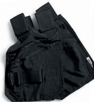
WERKZEUGTASCHEN 9201 ADKN