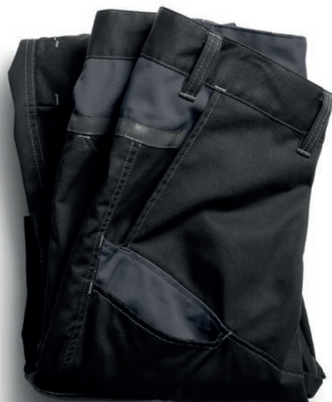
HOSE 2555 STFP HOSE 2552 STFP DAMENHOSE 2554 STFP