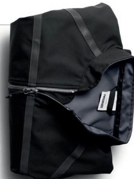
SOFTSHELL-JACKE 4557 LSH / SOFTSHELL-DAMENJACKE 4558 LSH