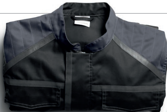
JACKE 4555 STFP / DAMENJACKE 4556 STFP