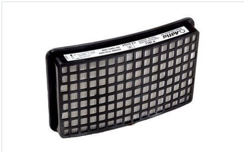
Marke: 3M Speedglas